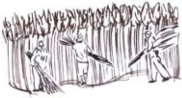
Constitution de bottes de chanvre