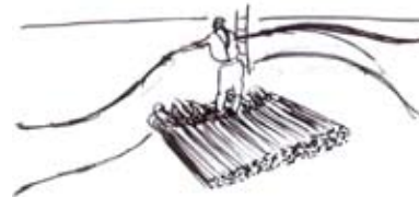
Rouissage (Macération dans l'eau)

Séchage à la façon des huttes puis à l'aide d'un four