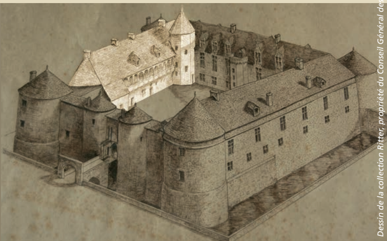
Dessin de la collection Ritter, propriété du Conseil Général des Pyrénées Atlantiques

Cette construction, attribuée à Alain d'Albret, arrière-arrière grand-père d'Henri IV, se compose alors de quatre ailes, de tours d'angle et d'une cour intérieure. Détruit en grande partie en 1793, seule l'aile nord, classée Monument Historique en 1862, est conservée aujourd'hui.